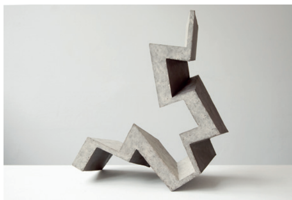
links: Balance VII, 2018, 25 x 30 x 18 cm