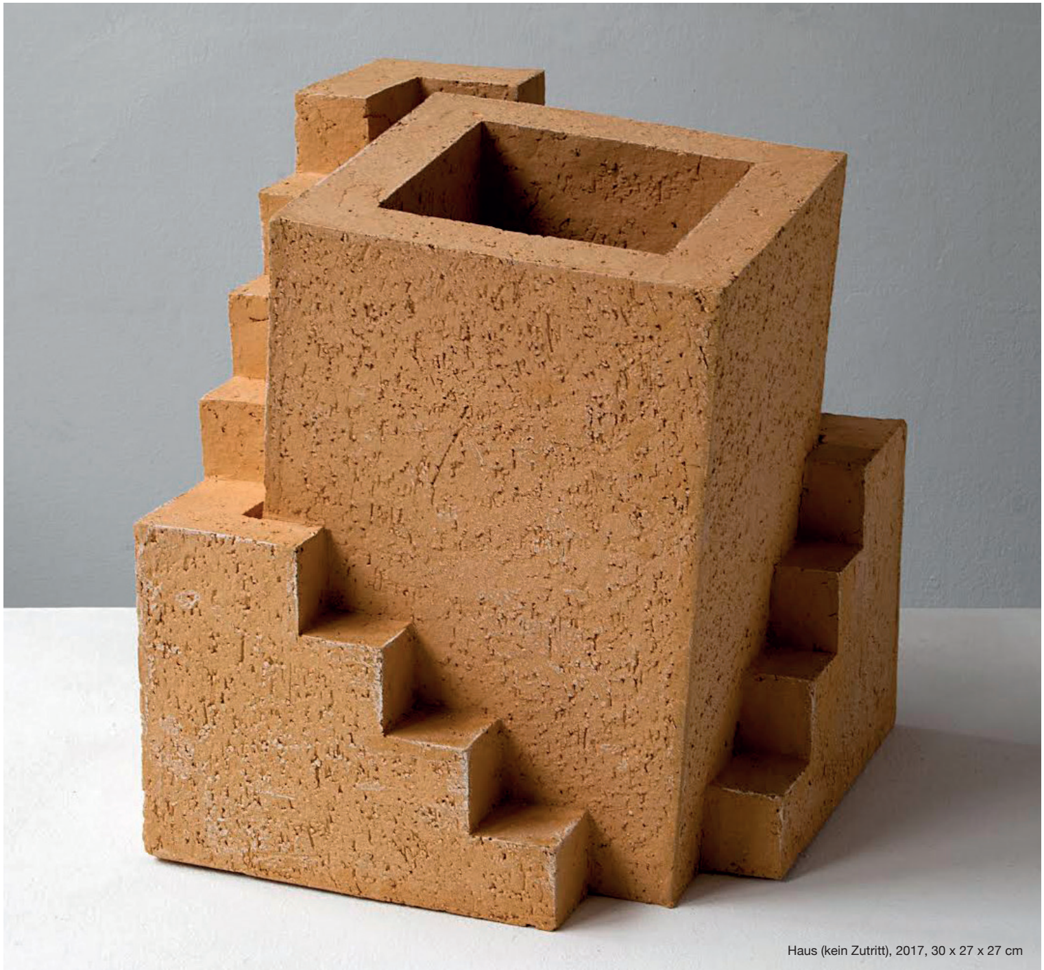
Haus (kein Zutritt), 2017, 30 x 27 x 27 cm